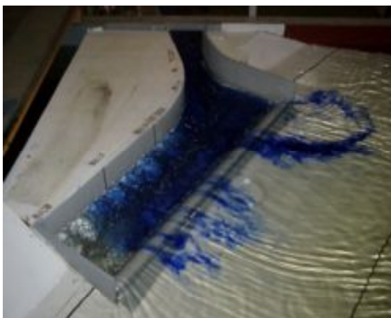
図-2 洪水吐流入部の水理実験