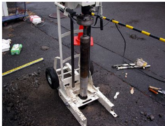
図-5 ネコドリルによる土壌試料採取