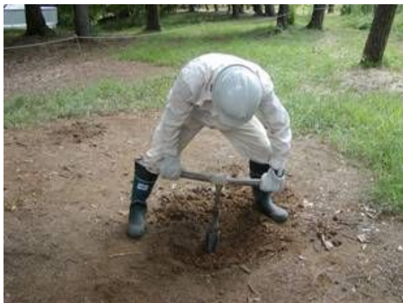
図-4 ハンドオーガによる土壌試料採取