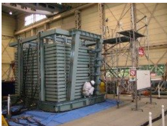
図-4 地盤液状化実験

例えば、構造物では地盤 - 構造物の相互作用評価実験としての液状化による杭基礎への影響評価実験や、砂地盤の液状化実験を実施しております。