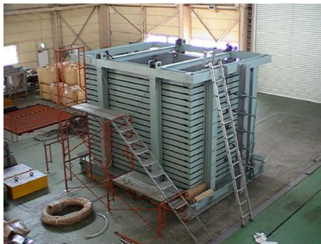
図-3 大型せん断土槽